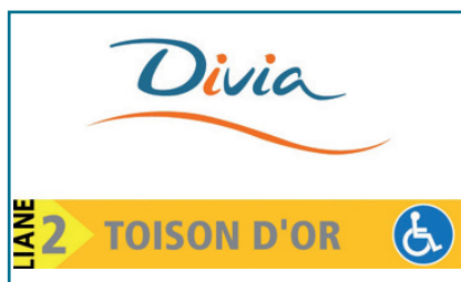
Signalétique sur vitre abribus

Une étude des «fichiers adresses» des adhérents au service DiviAccès se déplaçant en fauteuil roulant, combinée au positionnement des lieux les plus fréquentés (centres commerciaux, services publics, équipements de santé, de loisirs...) a permis d'identifier la Liane 2 comme étant prioritaire. Après concertation, ce choix a été validé par la Commission Intercommunale.